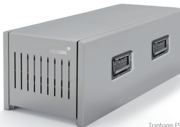
Tragbares ESS mit 10 kW

Die Minilith-Serie ist unabhängig von der Energieerzeuger- oder Ladequelle. Aufgrund der eingesetzten Technologien und Materialien, der Konstruktion sowie der Verarbeitungsqualität verfügen Minilith-Systeme über beeindruckende, technisch herausragende Leistungsdaten.